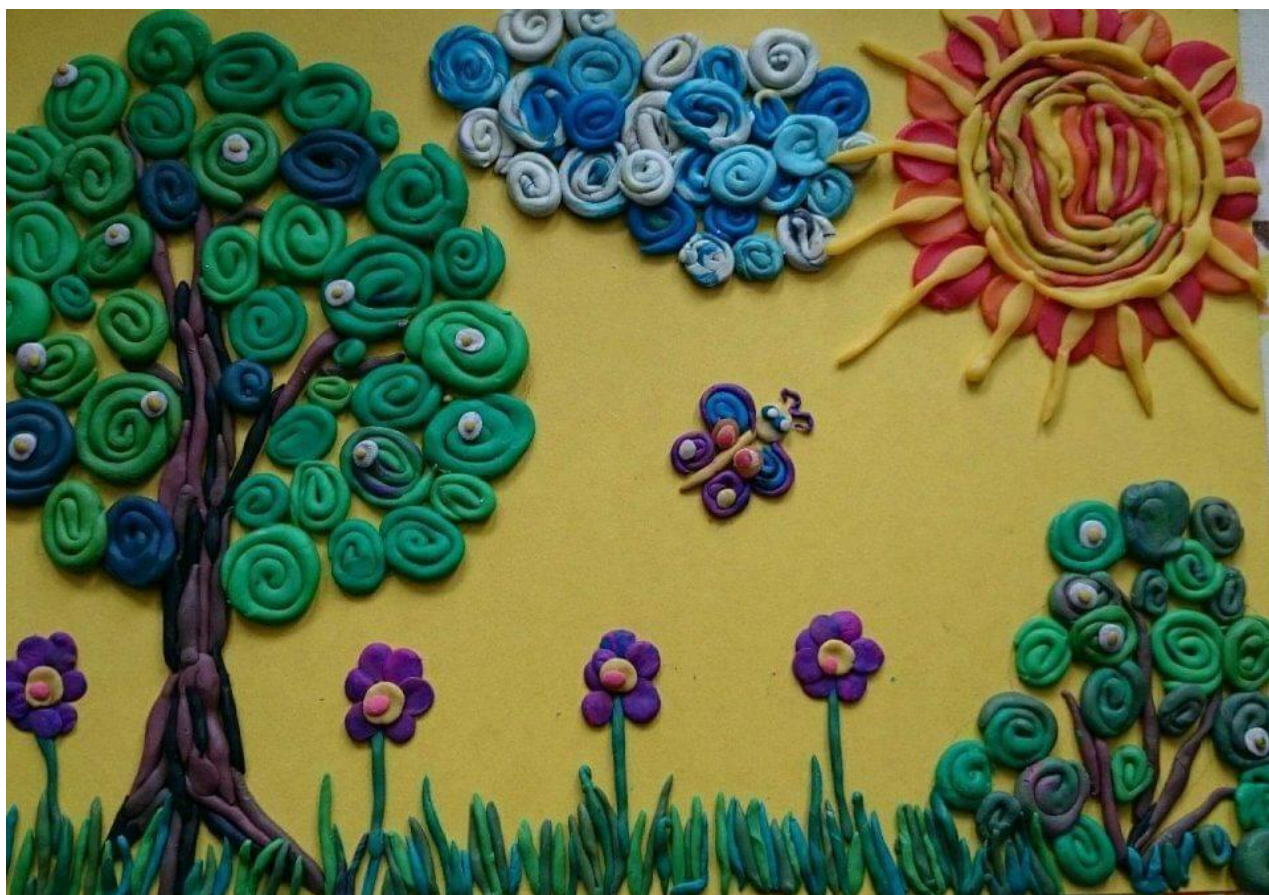
Пальчиковая игра «Апельсин» Мы делили апельсин.

5. Обучающимся предлагается выполнить предлагаемую работу по пластилинографии, используя картон, пластилин и стеки.